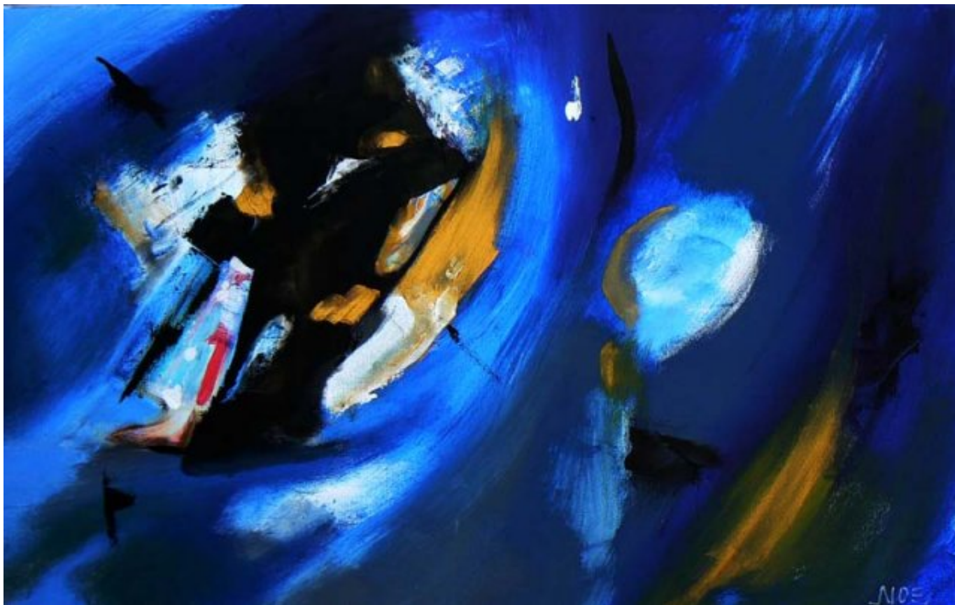
"Errant au bord de l'eau"

Et puis quelque fois, un simple mot ou une simple couleur devenait son idée de base pour peindre une œuvre.