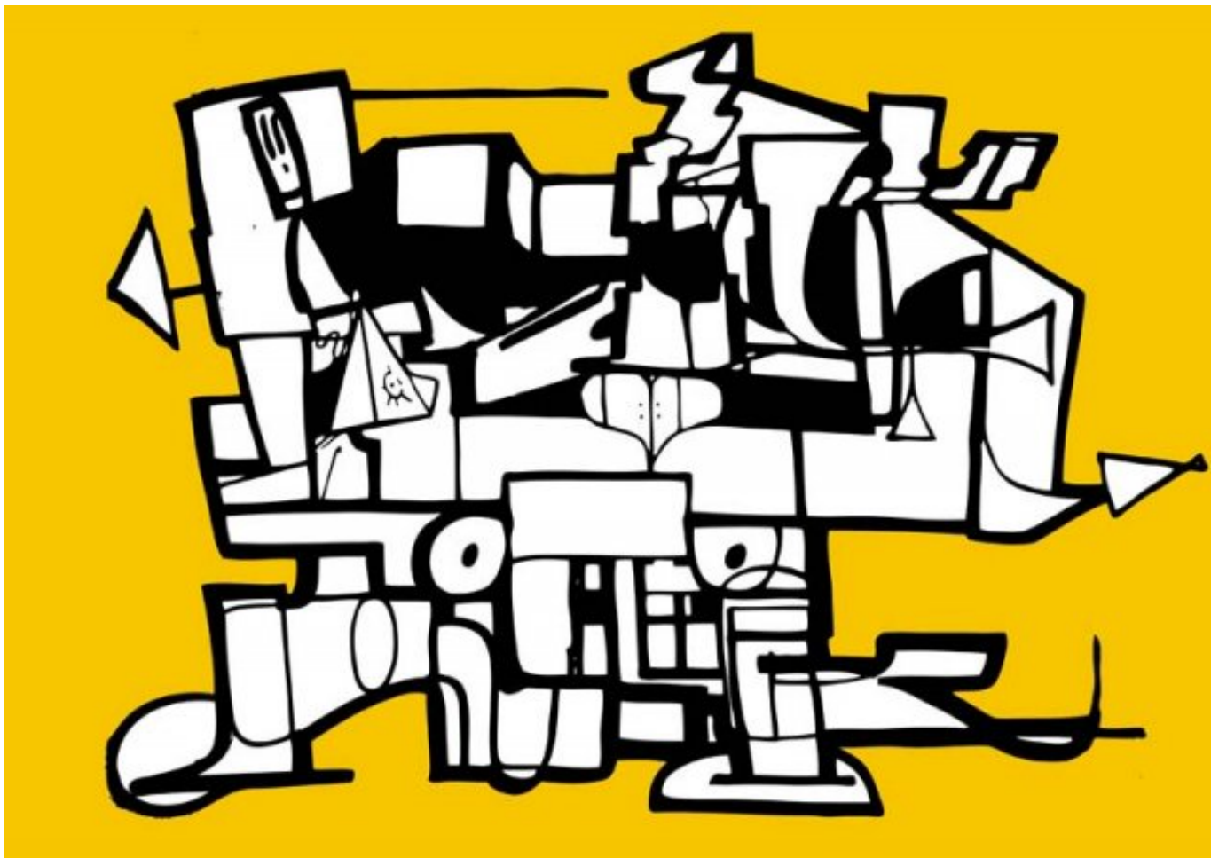
"Galactikos" par Noe

Je n'ai pas le sentiment qu'il y ait eu un message commun parmi toutes ses œuvres. Il n'utilisait pas l'art au service de quelque chose, il dessinait ou peignait son monde, selon son état d'esprit.